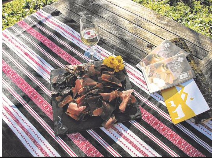
Pays-d'Enhaut – Produits authentiques, une aide précieuse pour ouvrir de nouveaux marchés.