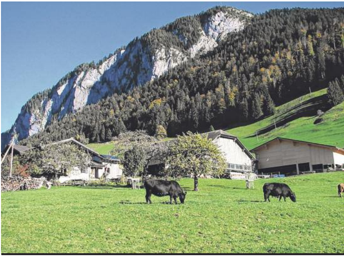
Vue de la ferme familiale et des deux stabulations avec, au premier plan, les bovins Aberdeen Angus.