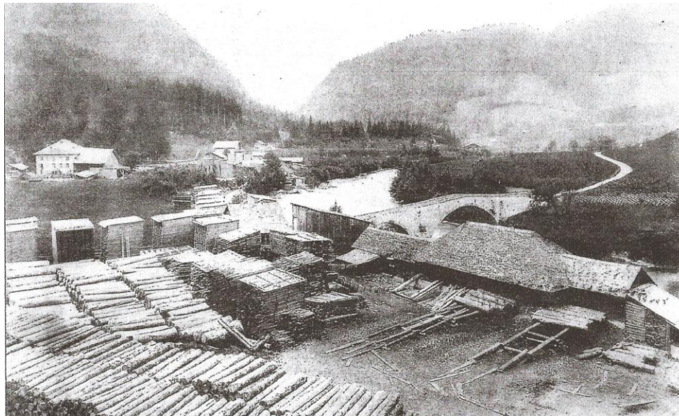
Scierie de la Tine, vers 1900.