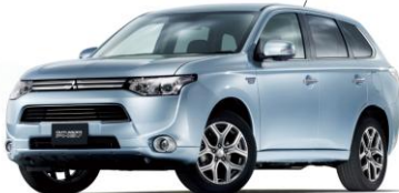
Mitsubishi Outlander Plug-In Hybrid