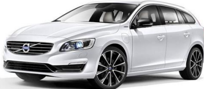
Volvo V60 Diesel Hybrid