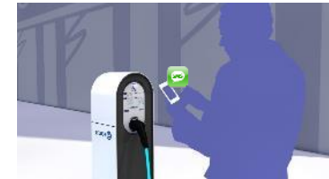
Paiement par SMS